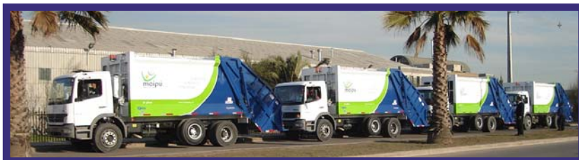
MUNICIPALIDAD DE MAIPU

El equipo esta constituido por dos estructuras principales, tolva y deposito de residuos, y los circuitos hidráulico, neumático y eléctrico.